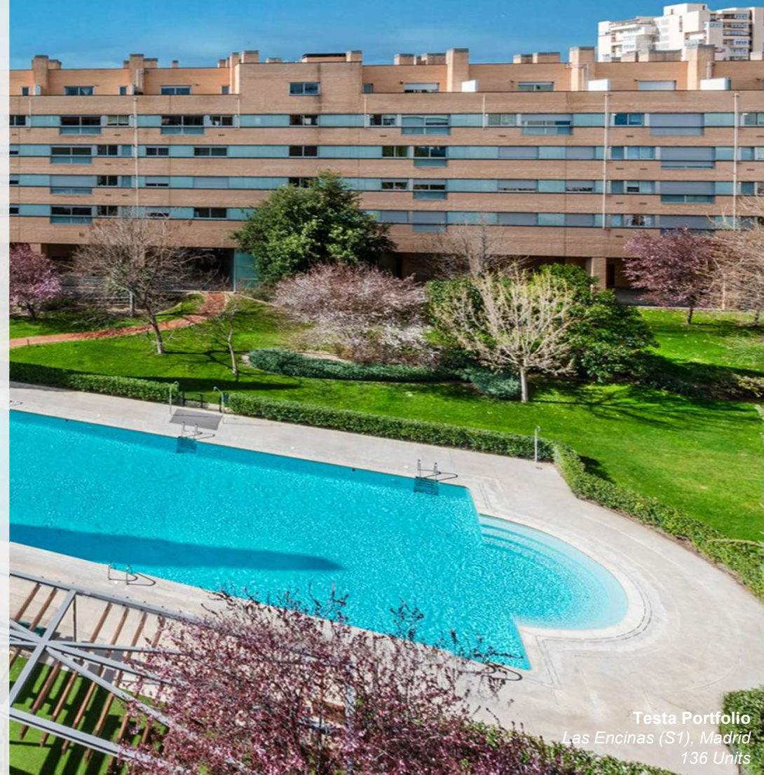
Testa Portfolio Las Encinas (S1), Madrid 136 Units