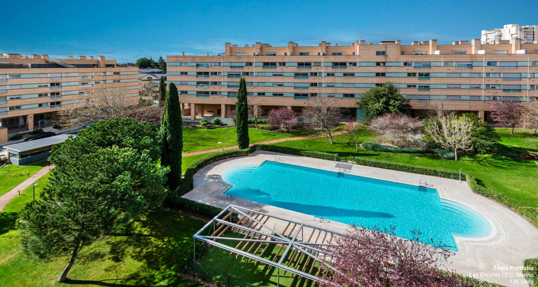
Testa Portfolio Las Encinas (S1), Madrid 136 Units